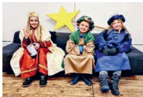
Nach drei Einsätzen sind die Sternsinger aus Zuckenriet müde, aber glücklich und können stolz sein, so viele Spenden für kranke Kinder gesammelt zu haben.