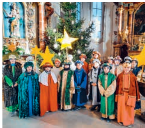
Mit dem Aussendungsgottesdienst in Niederhelfenschwil startete die Aktion 2022.

In der Woche nach dem Dreikönigstag waren zahlreiche Kinder und Jugendliche aus Lenggenwil, Zuckenriet und Niederhelfenschwil in den Dörfern als Sternsinger verkleidet unterwegs. Sie haben viele Menschen zu Hause besucht, Lieder gesungen und Spenden gesammelt. Wir möchten uns ganz herzlich bei allen Kindern und Jugendlichen bedanken und natürlich auch bei allen, die Gruppen begleitet haben und die Koordination der Aktion übernommen haben. Wir freuen uns schon darauf, gemeinsam mit euch bei einem «Dankefäschtli» diese gelungene Aktion zu feiern.