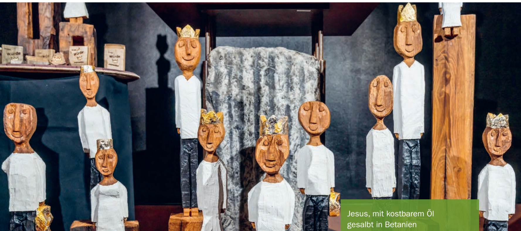
Königinnen und Könige, geschnitzt von Ralf Knoblauch, Diakon und Tischler in Bonn (D), entnommen der Website von Ralf Knoblauch, zur Veröffentlichung von ihm freigegeben.