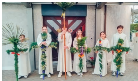
Palmsonntag in Züberwangen