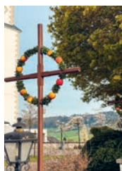
Palmsonntag in Lenggenwil

Der Jungwacht verdanken wir auch diese zum Palmsonntag schönsten Palmen, welche die kirchliche Umgebung schmücken. Ein herzliches Vergelt's Gott!