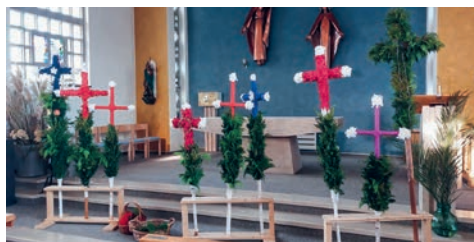
Palmsonntag in Zuckenriet

Am sonnigen Samstag, 12. April, und am Sonntag, 13. April, nahmen Klein und Gross an den Palmprozessionen teil. Die wunderschönen Kreuze und die Dekorationen waren bei der Feier im Vordergrund.