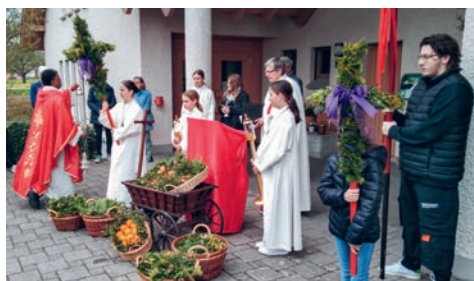
Palmsonntag in Zuzwil